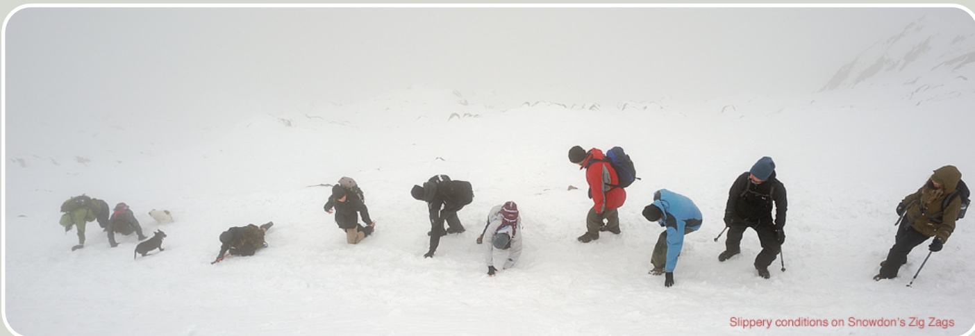
Slippery conditions on Snowdon's Zig Zags