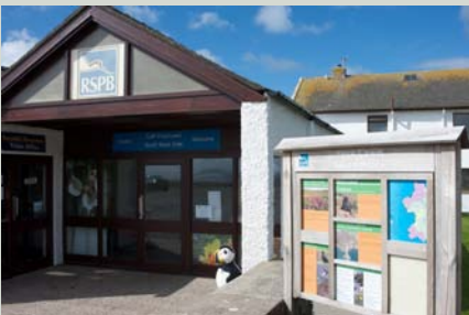
Caffi South Stack

Erbyn hyn mae Caffi South Stack yn eiddo'r RSPB ac, fel arbrawf, maen nhw'n cadw'r caffi ar agor tan 4 Ionawr gan obeithio y bydd cerddwyr a dringwyr yn taro i mewn m baned.